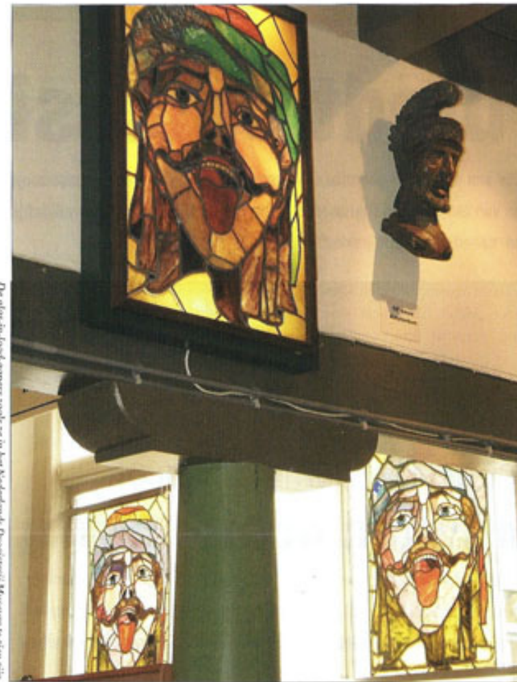
De glas-in-loodgapers zoals ze in het Nederlands Drogisterij Museum te zien zijn.

Nederlands Drogisterij Museum Diependaalsedijk 19c, 3601 GH Maarssen Telefoon: 0346 55 52 53 E-mail: info@drogisterijmuseum.nl Internet: www.drogisterijmuseum.nl en www.gapers.nl